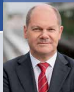
Olaf Scholz Erster Bürgermeister Freie und Hansestadt Hamburg